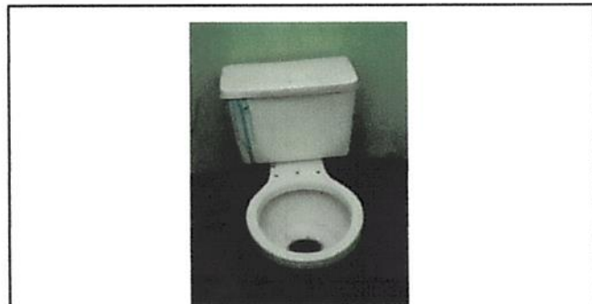
SUSTITUCION DE INODOROS Y ACCESORIOS

Observación: Si es necesario se pueden agregar hojas adicionales y actualizar el número de hojas.