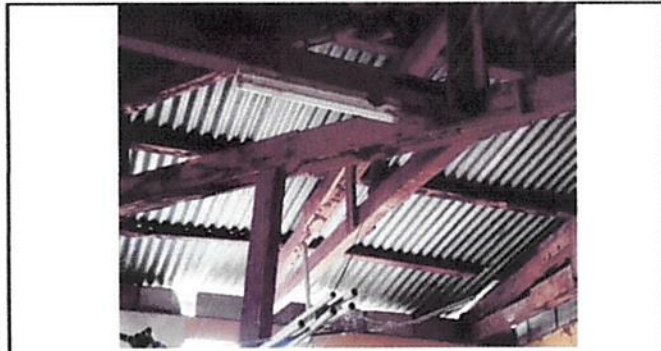
CAMBIO DE ESTRUCTURA EN CORREDOR