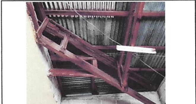
CAMBIO DE ESTRUCTURA EN CORREDOR