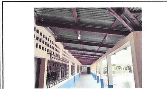
CAMBIO DE ESTRUCTURA EN CORREDOR