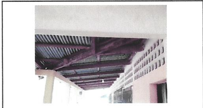
CAMBIO DE ESTRUCTURA EN CORREDOR